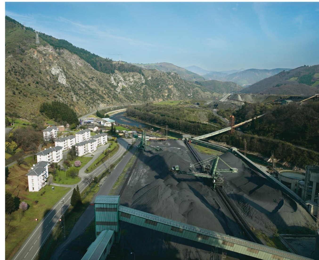
Parque de carbón de una central térmica.

La tecnología de la oxidación se usa en industrias como la del aluminio, vidrio, acero, aunque para