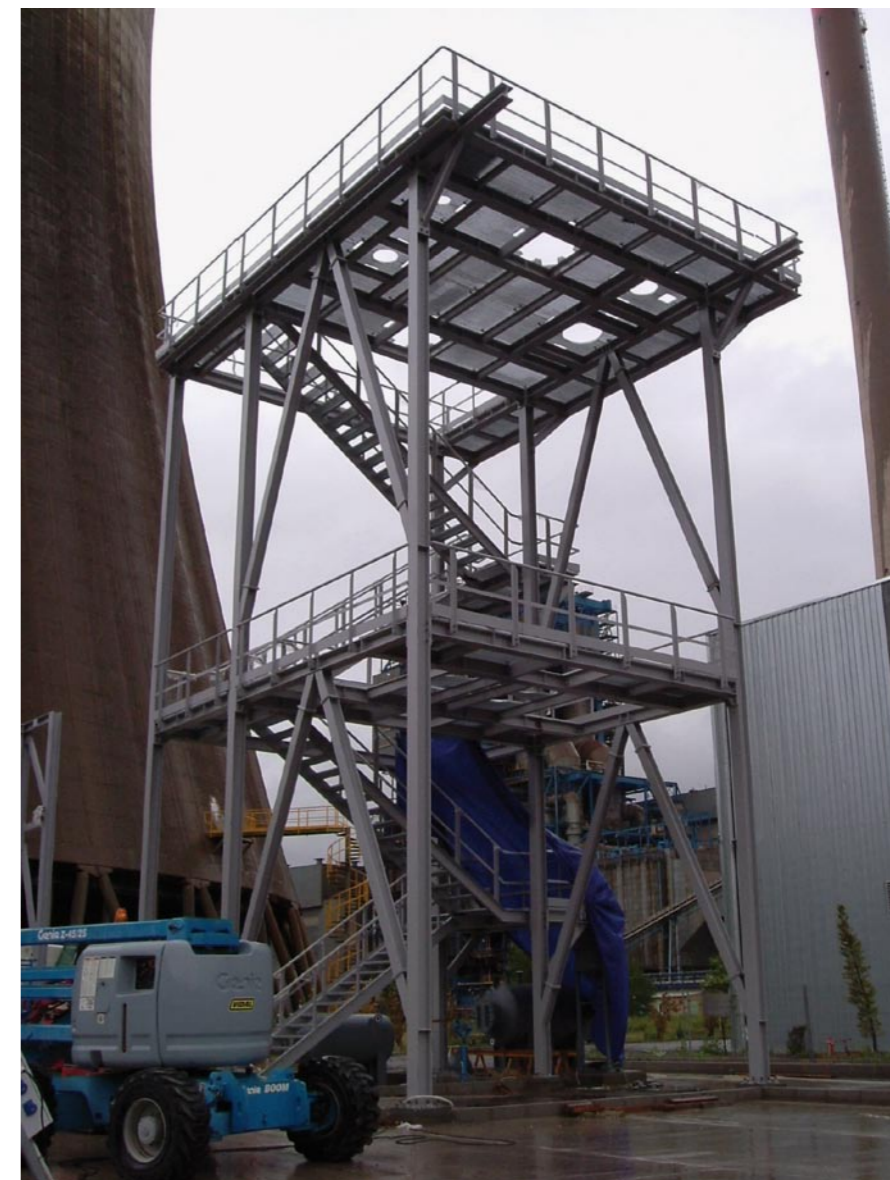
■ Planta experimental de captura de CO 2 adjunta a la central de La Robla (León).

En el proceso de precombustión, se captura el CO 2 antes de la etapa de combustión. Para ello, se transforma el combustible primario en una corriente de gases cuyos principales componentes son CO 2 e hidrógeno, los cuales pueden ser separados de forma relativamente sencilla. Las tecnologías de captura en precombustión se asocian, por su naturaleza, a los procesos de generación eléctrica mediante una gasificación previa del combustible